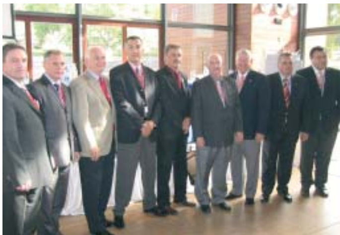
Neu gewählt: der neue Exekutive Rat des CTIF