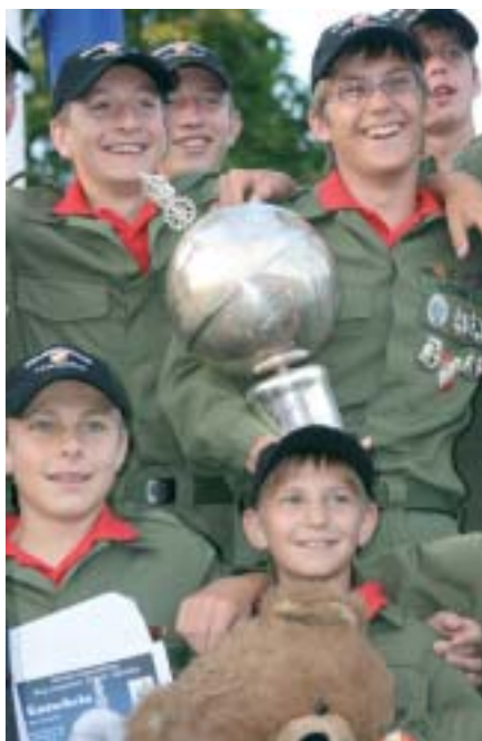
Die Jugendleiter-Kommission war auch für die internationale Jugendfeuerwehrbegegnung in Revinge (Schweden) zuständig